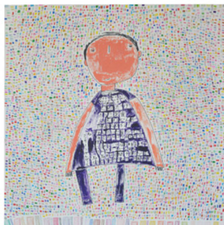
6. 井戸 友香里「昨年マイディアニューオーリンズ、アビヤントで退団した安蘭けいさん」