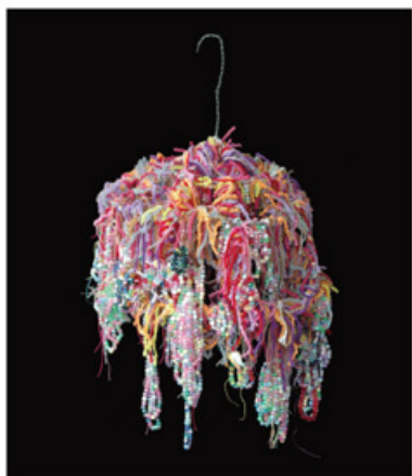
4. 井戸 友香里「スズ付きシャンレリア」