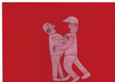
3. 寺井 良介「突き飛ばし退場」