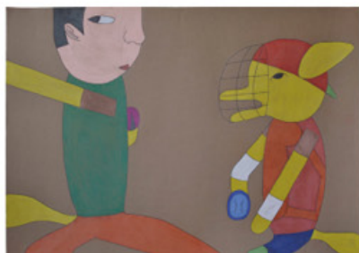
1. 寺井 良介「キツネバッテリー」

展覧会広報にご利用いただけるよう、画像データをご用意しております。ご希望の方は「広報掲載用写真貸与申込書」に必要事項を記入の上、下記【お問い合わせ】先までメールでお送りください。画像使用の際は、「作家名」とクレジット「©2010 atelier incurve」を記載していただき、画像の部分使用やトリミング、文字を重ねるなどの処理はご遠慮願います。掲載記事・番組内容について、基本情報確認のため、原稿を下記【お問い合わせ】先までメールでお送りください。お手数ですが、掲載紙・誌または録画テープを2部ご寄贈ください。