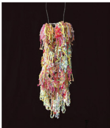
5. 井戸 友香里「落ちるシャンレリア」