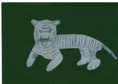
2. 寺井 良介「虎」