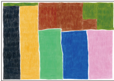
1. 信谷 弘光 「タイトルなし」(21-0056)

展覧会広報にご利用いただけるよう、画像データをご用意しております。ご希望の方は「広報掲載用写真貸与申込書」に必要事項を記入の上、下記【お問い合わせ】先までメールでお送りください。画像使用の際は、「作家名」とクレジット「©2012 atelier incurve」を記載していただき、画像の部分使用やトリミング、文字を重ねるなどの処理はご遠慮願います。掲載記事・番組内容について、基本情報確認のため、原稿を下記【お問い合わせ】先までメールでお送りください。お手数ですが、掲載紙・誌または録画テープを1部ご寄贈ください。